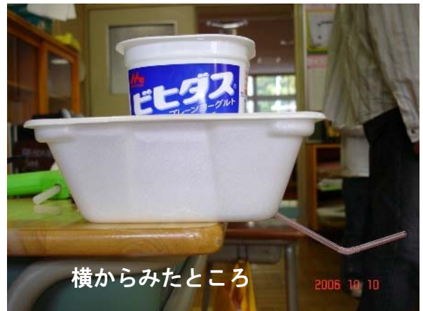
横からみたところ