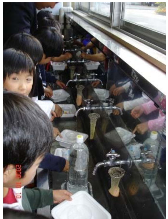
流しに水をためてさあ進水！