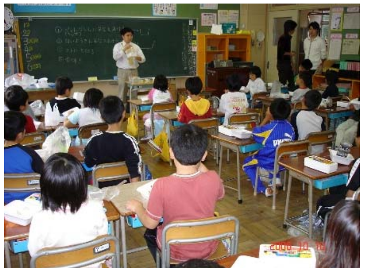
葛巻小学校での授業風景