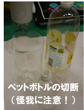
ペットボトルの切断 (怪我に注意！)